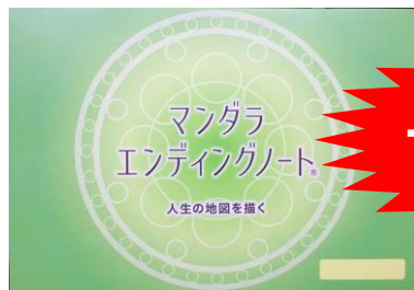
(マンダラエンディングノート)